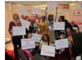
トランスジェンダーのアクティビストたちが掲げるプラカードの「数々」"No more MSM/TG, but Transgender" (もう MSM と一緒にしないで) "We are left behind" (私たちを置き去りにするな) "No more Lip Service" (リップサービスはもういらぬ) "We need separate funding" (私たちに特化・独立した助成金を!) といった主張が書かれている。

左下の写真に注目して欲しい。これは、トランスジェンダーのアクティビストたちによるデモ行進直前の記念写真である。彼らが掲げるプラカードには、"No more MSM/TG, but Transgender" (もう MSM と一緒にしないで) "We are left behind" (私たちを置き去りにするな) "No more Lip Service" (リップサービスはもういらぬ) "We need separate funding" (私たちに特化・独立した助成金を!) といった主張が書かれている。トランスはエイズ予防対策事業においてまだまだ不可視化された存在であり、事業費・助成金の類は、LGBT 支援や MSM コミュニティ支援という一括された形で流れ、トランスの当事者団体に独立した形では配分されてこなかった。LGBT コミュニティが連帯することの意義は言うまでもないが、T がほとんど「お飾り」のように、あるいはアリバイ作りに付け加えられている現状に対する不満は強い。そのことがトランスに特化、独立した予算配分をせよ。お金をもらった団体や組織は使途を明確にせよ、といった訴えにつながっているのである。