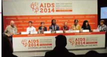
「スティグマと差別」に関する記者会見の様子。登壇したのはキー・ボビュレーションを代表する面々で、反同性愛法が成立したばかりのナイジェリアで法案成立の前と後でそのインパクトを調査した研究者、ナイジェリアの権利擁護団体代表、薬物使用者の支援団体代表、セックスワーカー当事者団体の代表、トランス当事者ネットワークの代表、ヒューマンライツ・ウォッチ代表など。

厚生労働省エイズ対策事業・研究班「日本の性娯楽施設・産業に係わる人々への支援・予防対策の開発に関する学際的研究」(2006~2008年度)をきっかけにSWASHとつながり、その後も「個別施策層(とくに性風俗に係る人々・移住労働者)のHIV感染予防対策とその介入効果に関する研究」(2009~2011年度)で調査研究を共にしてきた。今回のメルボルンを含め、これまでも何度か国際会議や全米セックスワーカー会議などを一緒にしているのだが、