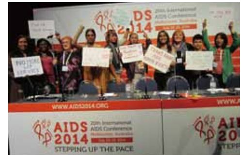
「スティグマと差別」に関する記者会見の終了直後、世界各国の仲間とトランスジェンダーの直面する問題を訴える筆者（写真右端）

会議では、トランスジェンダーはその外見からすでにからかいや暴力の対象とされたり、差別や偏見によって