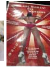
セックスワーカーのブースに貼られていた移民セックスワーカーのポスター

エイズ国際会議、セックスワーカープレカンファレンス。記念撮影。シャッター合図は「money(o^^o)!!」全員サイコーの笑顔になった瞬間…。さすがです。