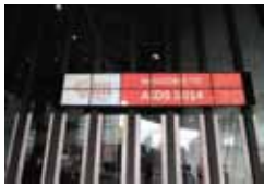
会場となったメルボルン国際会議場入り口

仕事柄、国内外の学会・会議に出席する機会が多い私は、国際エイズ会議の雰囲気がよく「好き」である。どの学会・会議に行ってもほとんど観光らしきことはせず、会議会場やミーティング場所と宿泊施設の往復を繰り返すだけなのだが、エンパワされるというのは正にこういうことを言うのだと実感できるからである。最近「パワー・スポット」なる場所を訪れる人たちの話を聞くと、その感覚に近いのかもしれない。