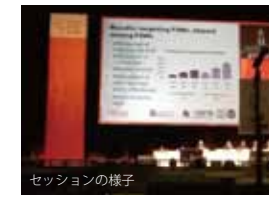
セッションの様子

女性のドラッグユーザーの抱える困難さについてのセッションにも行きました。ドラッグを使うか否か、が問題の全てではないという認識を多くの人が持てるという。ドラッグのことだけじゃない話。正論(に見えるもの)には気をつけなと。