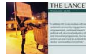
医学雑誌 ランセット

SW コミュニティの取り組みは医学雑誌ランセットにセックスワークの非犯罪化が HIV 予防にとって急務であると報告されたことがエイズ会議の中でも注目されていました。社会環境の構築によって人命が守られることへの明確なエビデンスが提示されたと言っても過言ではないです。