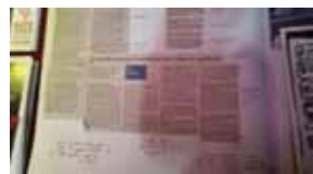
SW について問題のある記事にダメ出しする活動をしているオーストラリアの SW 団体 Debbly

ピアエデュケーションワークショップでは、各国のピアエデュケーターやアウトリーチワーカーが自国で当事者たちにレクチャーしている、安全な働き方、サービス提供の仕方についてのデモンストレーションが行われ、SWASHも発表を行いました。