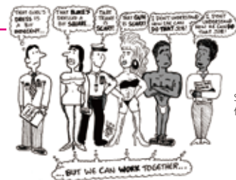
SWOP の警察研修資料の一部