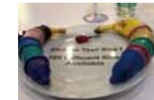
コンドーム会社のブース

パキスタンのトランスジェンダーのドキュメンタリーをみて意識なんて間違ったら申し訳ないのだけど「私がこの道を行くだけで、家族たちを苦しめることになる。私はただシンプルに幸せな日々を望んでるだけ。私の幸せは好きな格好、メイク…」とため息まじりに言っているいろいろ詰まった。