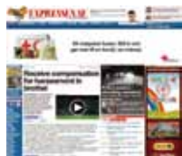
SW にセクハラをしたオーナーに対して賠償金を課すことを伝えるニュース

使用を課す売買改善法（2003）や「ニュージーランドの性産業における職業上の健康と安全に関する手引書」（2004年労働省※1）の政策も労働の安全に非常に役立つものでした。一方、セックスワークが非犯罪化されていなくても、労働であることに違わず、労災や被害については救済されるべきで、また可能であるケースについても話し合われました。