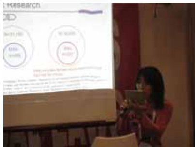
日本のエイズ対策事業において可視化されているトランスジェンダー・セックスワーカーの現状について発表する筆者

本会議における私の主な目的は、トランス女性（出生時に付与された男性としての性別を越境する女性）、およびセックスワーカー女性のエイズ対策をめぐる日本の現状と課題について発表するとともに、海外の自助グループが持つトランスピープルやセックスワーカー支援のための知見を学ぶことでした。