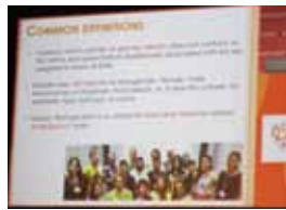
WHO『キー・ポピュレーションの HIV 予防、診断、治療、ケアに向けた統合ガイドライン』に関するシンポジウムで紹介されたトランスジェンダーの定義

【※1】トランスジェンダーの円卓会議で、その存在が犯罪化されているイスラム圏のアクティビストが「ごめん下さい。私達の国では GID という概念をまだ使っています。イスラム教の指導者や政府と対話するには、医学的疾患概念が有効だから」と発言した。「ごめん下さい」と言った背景には、国際的に展開されている「脱精神病理化運動」がある。国際的診断基準である DSM-5 から GID は消え、GD に名称変更された。2017 年に発表される予定の WHO 国際疾病分類 (ICD-11) では GID も GD も使用されない可能性もあるという。日本で使用する言語を変えるタイミングは「いま」なのである。