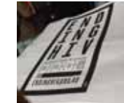
エイズ国際会議 2014のガイドブックの裏表紙

タイのセックスワーカー支援団体エンパワーの素晴らしさの一つには戦略力。英語が第一言語でないのに英語圏ではパフォーマンス力を活かす。対外的に訴えるために会場内の誰もが通る道で行うなど。