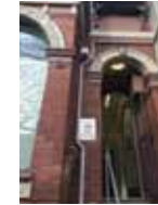
検査無料クリニック

アウトリーチでは、M、L、LL コンドームが 20 個（日本でワーカーが使用するの S、M、L が主流）グローブ、デンタルダム（クニリングス用シート）、ループ（LUBE・ローション）、セックスワーカー向け冊子、悪いお客さん等の情報が載った冊子を各一人一人に配布しました。